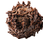
Cognac des Charentes 080108