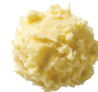
Eau-de-vie de poire Williams 080101