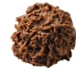
Calvados de Normandie 080105